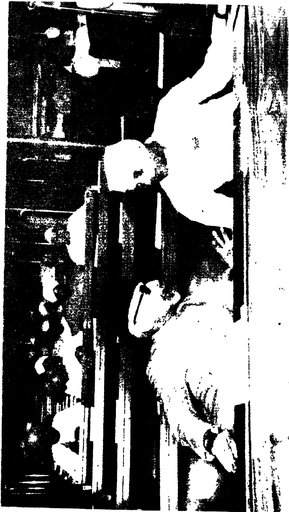
सविधान सभा के सत्र के दौरान मोलाना अबुल कलाम आजाद और पंडित जवाहरलाल नेहरू